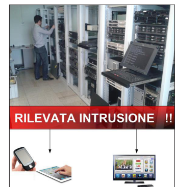
Fig. 2 Videosorveglianza - messaggio di allarme