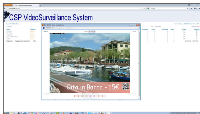
Fig. 1 Videopromozione - interfaccia di gestione unificata e messaggio promozionale

Il sistema permette inoltre di aggiungere dati contestuali ai flussi video trasmessi dalle varie telecamere, consentendo la fruizione da parte dell'utente di contenuti a valore aggiunto di varia natura: di approfondimento, turistica e promozionale. Un sistema di accesso strutturato e l'interfaccia di amministrazione unica , consentono inoltre di profilare gli utenti, differenziando l'abilitazione a risorse diverse in base al segmento di appartenenza. La protezione civile, ad esempio, avrà così accesso a contenuti video trasmessi da telecamere situate in contesti critici, mentre un comune utente vedrà contenuti video di pubblica utilità o promozionali.